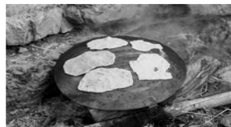
אפיית פיתות על כלי ברזל עגול

סוג הלחם קשור לא רק לתנאי האקלים אלא גם לכלים העומדים לרשות האדם בכל אזור. למשל לשבטי נודים החיים במדבר אין תנורי אפייה, ולכן הם אופים פיתות ישירות על גחלי המדורה או על פלי ברזל עגול הדומה למחבת הפוכה. הפיתה מוקרת בישראל ובארצות רבות במזרח התיכון ויש לה מגוון צורות וטעמים.