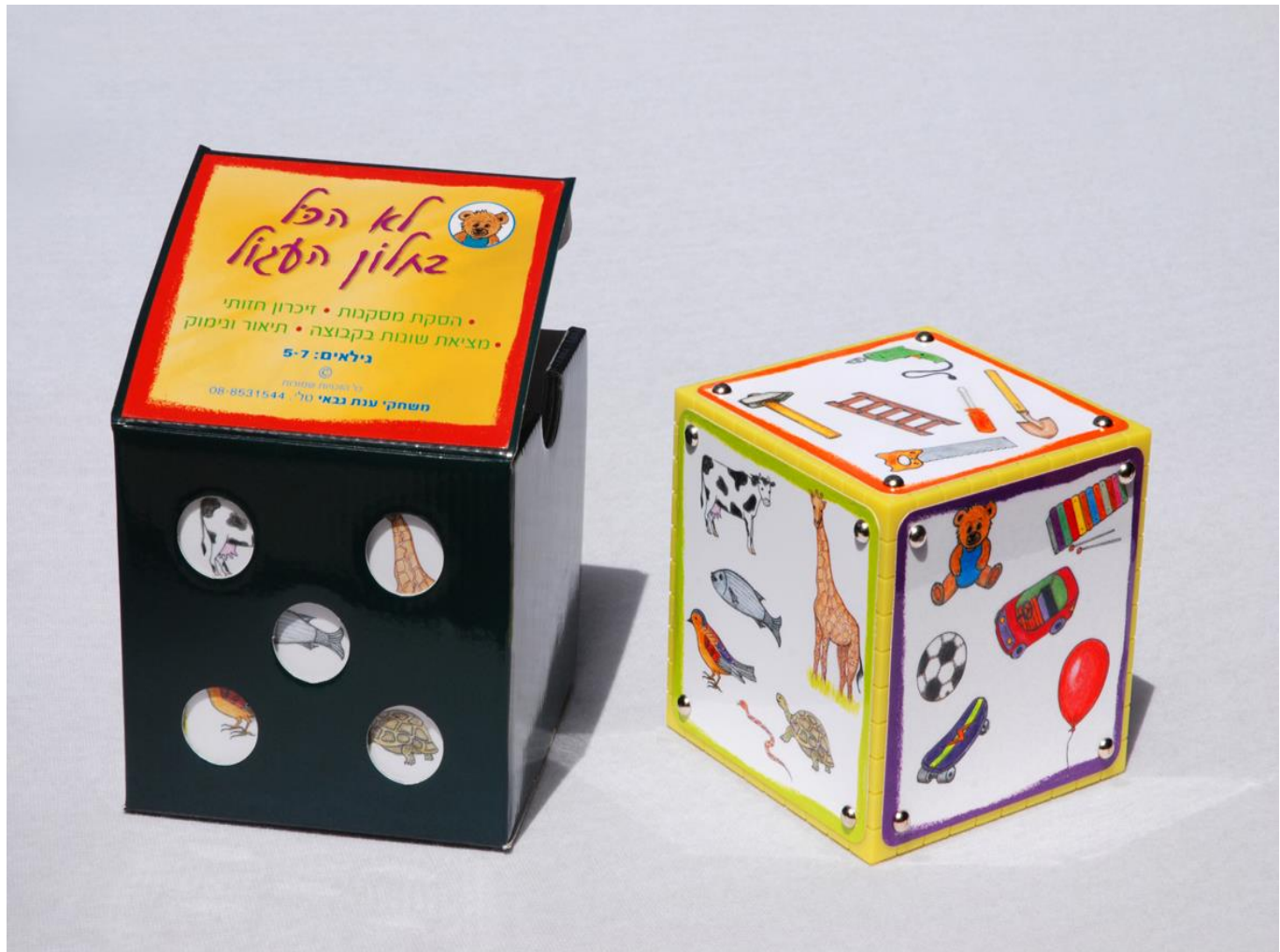
כל הזכויות שמורות לד"ר ענת פרישמן שטרית